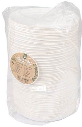
Immagine del pacchetto